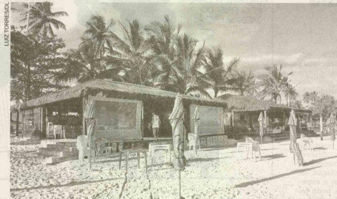
A menos de dois meses para o Início da temporada de Verão, Guarujá tenta reverter a imagem negativa dos últimos meses